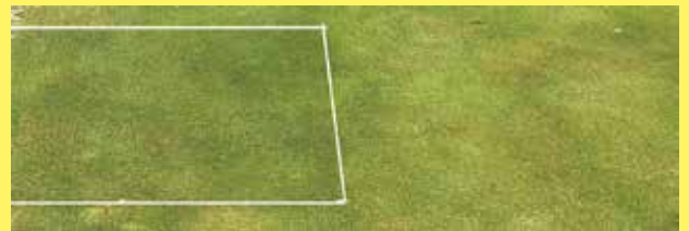
左：マイナース処理区