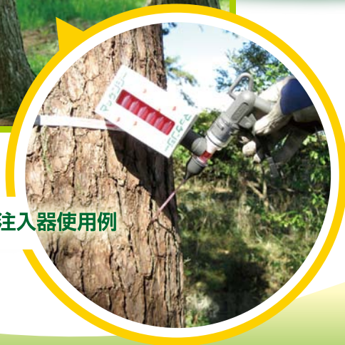
専用注入器使用例