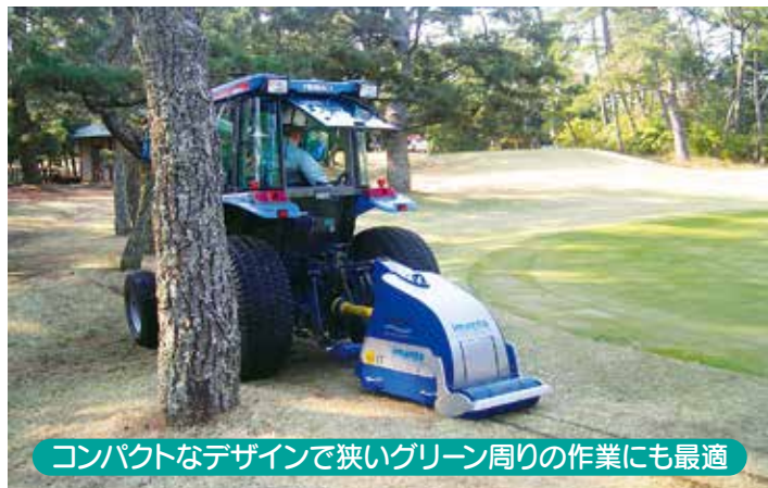
コンパクトなデザインで狭いグリーン周りの作業にも最適