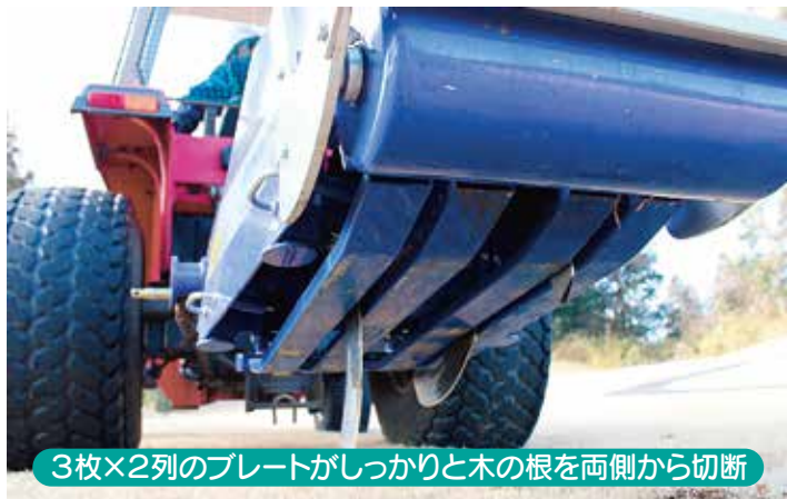
3枚×2列のプレートがしっかりと木の根を両側から切断