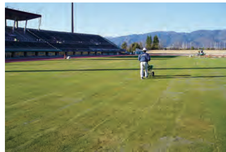
ビッグロール工法施工後の状況