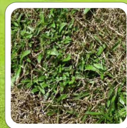
ウラジロチチコグサ