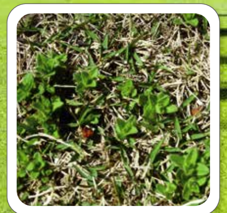
オランダミミナグサ