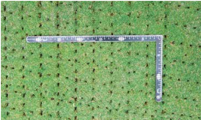
ダブル走行により、定着率を飛躍的にアップさせます