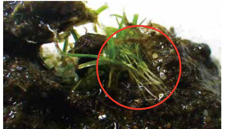
作業7日後、穴に入った種子の発芽を確認