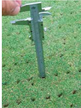
最大深度=15mm ※条件により異なります