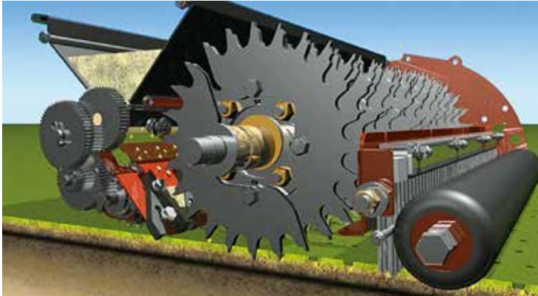
種を確実に土壌中に埋め込む設計。安心・確実の定着率を実現！ スパイクング作業も可能