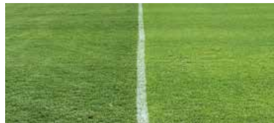
白線より左が「フィエスタ5」、右が「ゲイター3」。緑度の違いが解ります。

分けつに優れ、弊社取り扱いペレニアルライグラス品種「トルシヨン」や「ゲイター3」に比べ濃緑色です。