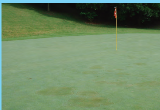
葉腐病 (ブラウンパッチ)